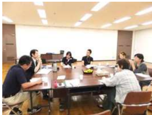
キャラクター選定会の様子